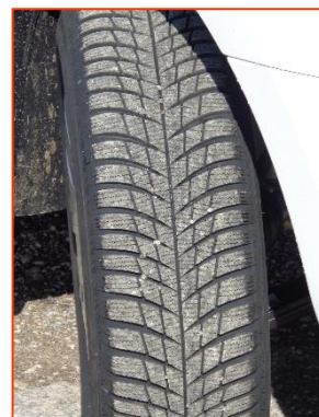
Pneumatiques « M + S »