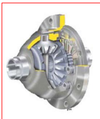
Différentiel à glissement limité