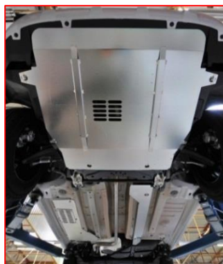
Protections sous moteur et sous caisse