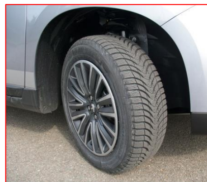
Pneumatiques « M + S »