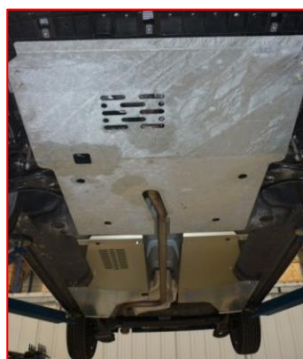
Protections sous moteur et sous caisse