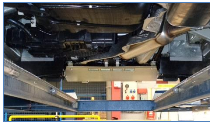
Protections sous moteur et bavettes spéciales sous caisse anti projections