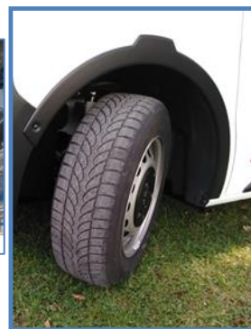
Pneumatiques « M + S » et protections d'ailes